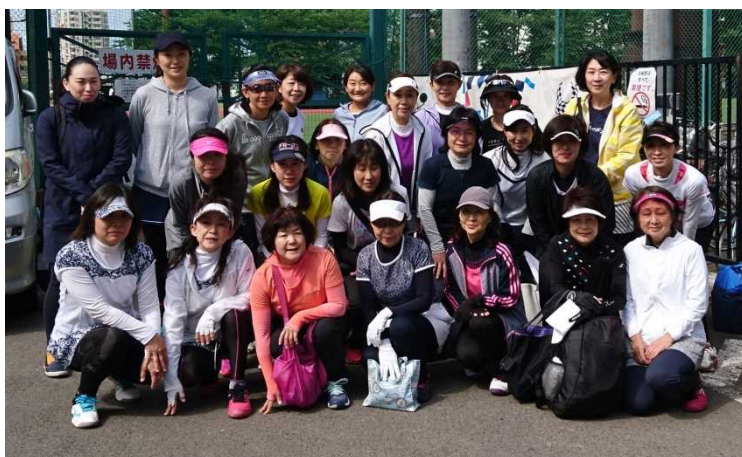
女子Ⅰグループの皆さん

参加申込は 男子(14組) 女子(25組)と大きな差がありましたので、女子は2グループに分け男子と合わせ合計3グループで、リーグ戦と各グループ1位決定戦を行いました。