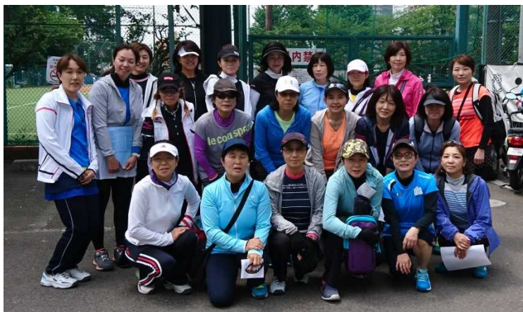
女子Ⅱグループの皆さん