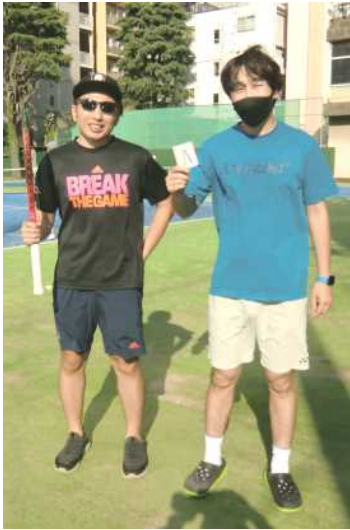
Aリーグ優勝 石島・大菌 (個人)