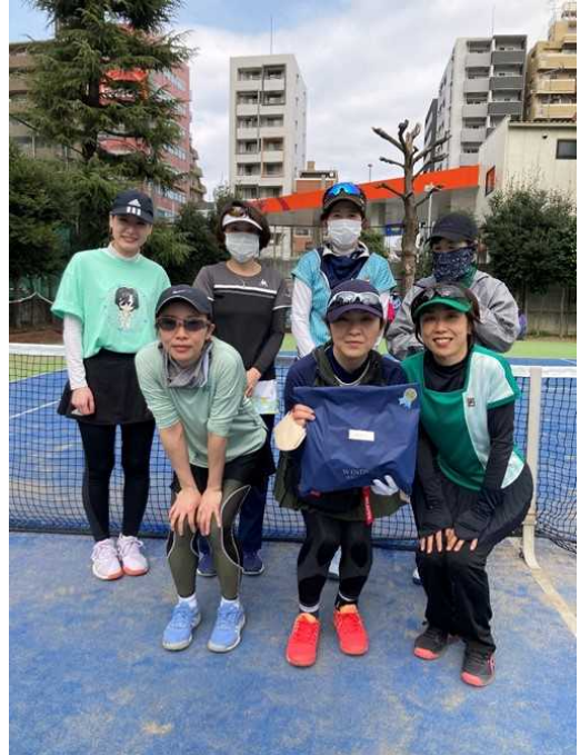
準優勝：グリーンガーデン