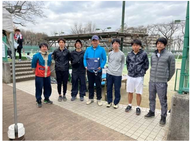
準優勝：郵政クラブ