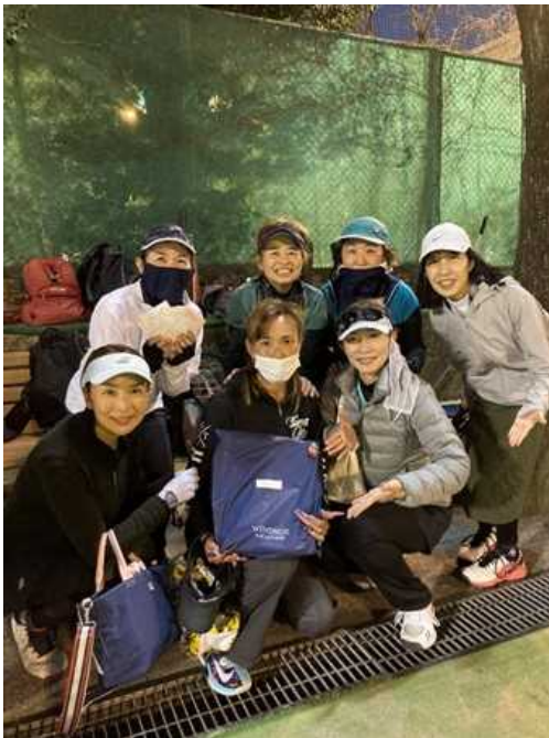
優勝：グリーンガーデン