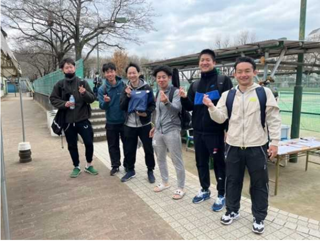
優勝：ショートスリーパーズ(山口)