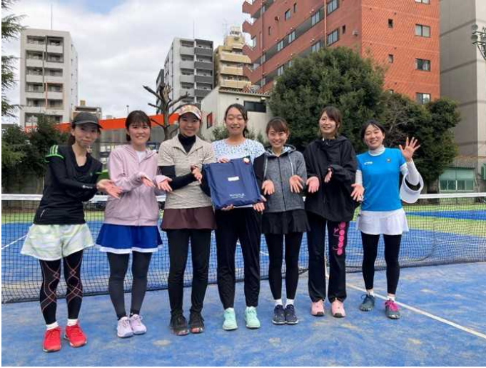
優勝：ショートスリーパーズ