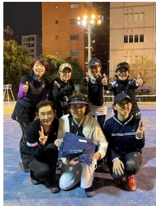
準優勝：早朝練習会(菊池)